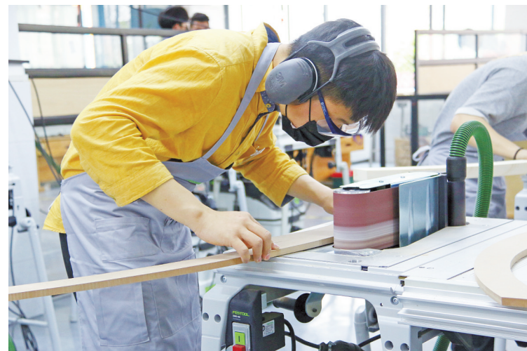
精细木工比赛现场。

本报讯(记者周琼 通讯员任社)飞舞的焊花闪过,平滑漂亮的焊接纹路让人感觉到这些冰冷的焊件就是一件件的艺术品;从一份简单的产品图纸,回溯到制作产品的模具,并动手打磨出精致的成品……昨天,全省最优秀的年轻“匠人”,在宁波技师学院亮出绝技,分别在焊接、电气装置、精细木工和塑料模具工程四个项目中,冲刺世界技能大赛的省选拔赛。