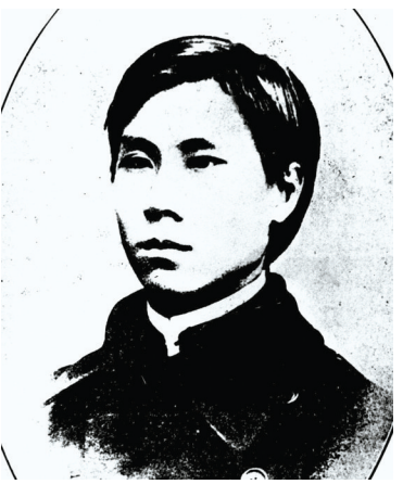
邹容像（资料照片）。

《革命军》深刻揭露了清政府的封建专制，是中国近代史上第一部系统地宣传革命，主张建立民主共和的著作。刚一问世，就被不少人称之为“今日国民之第一教科书”。1903年起，《革命军》先后在上海、新加坡、日本、香港、美国等地翻印29版，发行100万册以上，占清末革命书刊销量的第一位。清政府惊慌失措，与帝国主义相勾结，制造了震惊中外的“苏报案”。同年6月29日和30日，巡捕先后闯进《苏报》馆和爱国学社，捕去章炳麟等人。7月1日，18岁的邹容独自步行到租界监狱，自报姓名，慷慨入狱。1904年5月21日，邹容被判“监禁二年，罚作苦工，限满释放，驱逐出境”。由于狱中非人的生活，1905年4月3日，邹容病逝于上海提篮桥监狱。时年20岁。辛亥革命后，孙中山追赠邹容为“陆军大将军”荣衔，并赞叹“惟蜀有才，奇俊瑰落”。1944年，国民政府决定将原夫子池洪家院子至苍坪