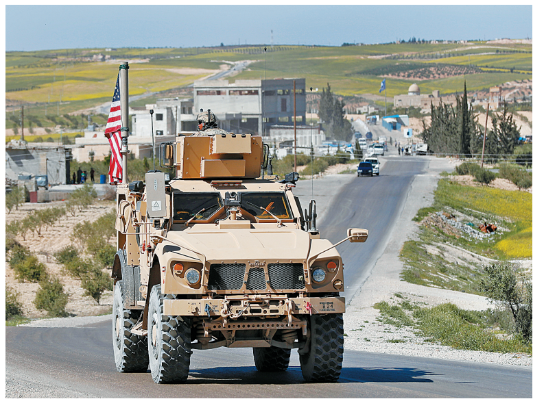
4月4日，一辆美军装甲车行驶在叙利亚北部重镇曼比季的道路上。

核心提示 土耳其、俄罗斯和伊朗三国领导人4日在土首都安卡拉举行会晤，就政治解决叙利亚问题达成多项共识。通过此次会晤可以看出，土俄伊三国在解决叙利亚问题上继续以“抱团”之势密切协作。特朗普3日表示，过去十余年，美国在中东地区的军事行动耗资巨大却“一无所获”，将于近期就是否从叙利亚撤军作出决定。他希望美军能从叙利亚撤离。分析人士指出，尽管特朗普政府近日表示出从叙利亚撤军的意向，但存在变数。叙利亚和平进程前景依然充满不确定性。