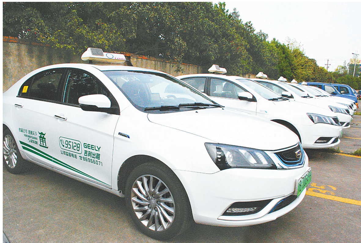
吉利纯电动出租车外形醒目。

“传统出租车都以‘浙BT’开头,而纯电动出租车,牌照开头改成了‘浙BD’,牌照上的数字也由5位变成6位。”北仑区交通部门相关负责人介绍。