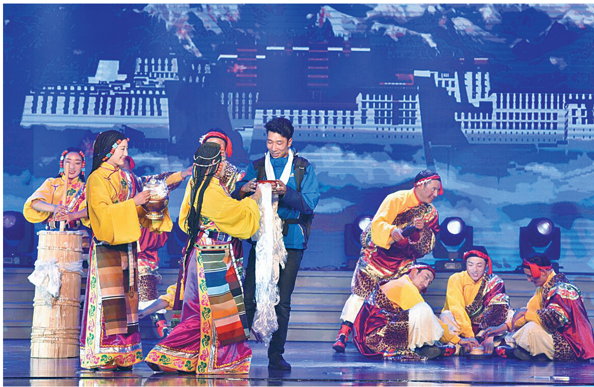
比如县民族艺术团献演的《我的援藏大哥》。