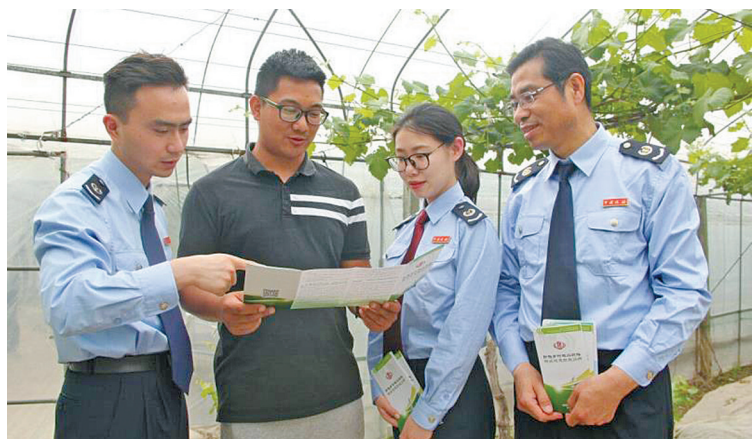
为进一步助推乡村振兴,余姚国税局泗门分局税务干部通过多种方式深入开展税收优惠政策宣传,努力让纳税人应知尽知。图为税务干部向纳税人宣讲涉农税收优惠政策。