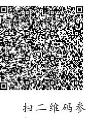
扫二维码参加抢书活动