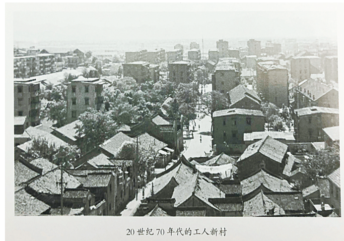
20世纪70年代的工人新村