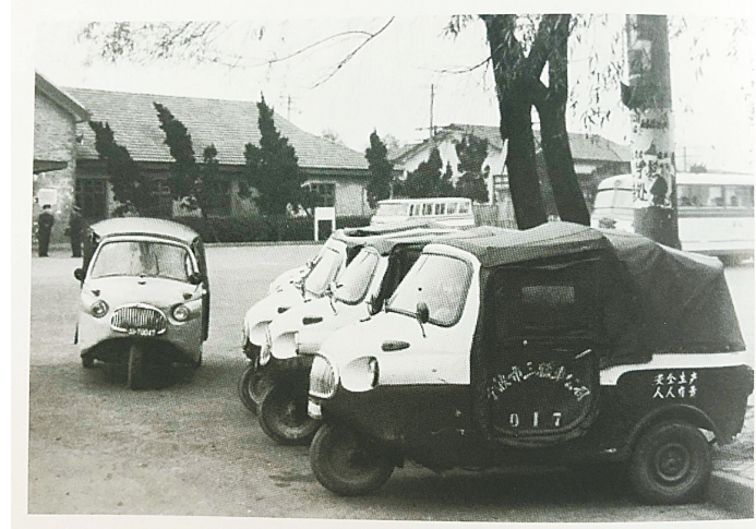
20世纪60年代,在火车站门前候客的市三轮车公司机动三轮车