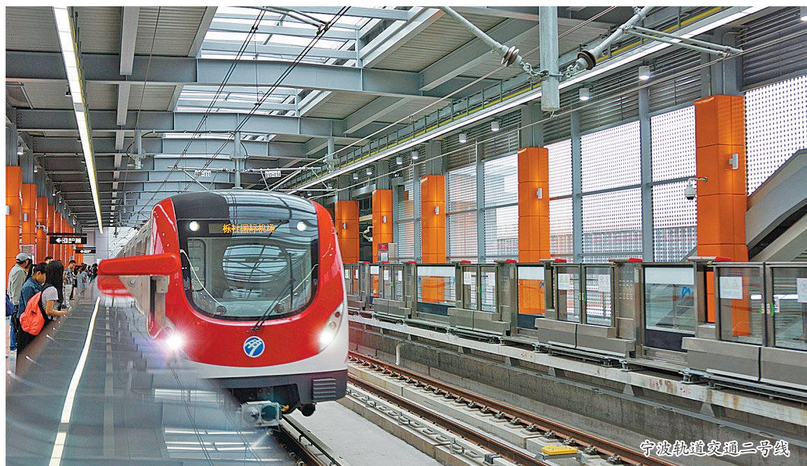
宁波轨道交通三号线