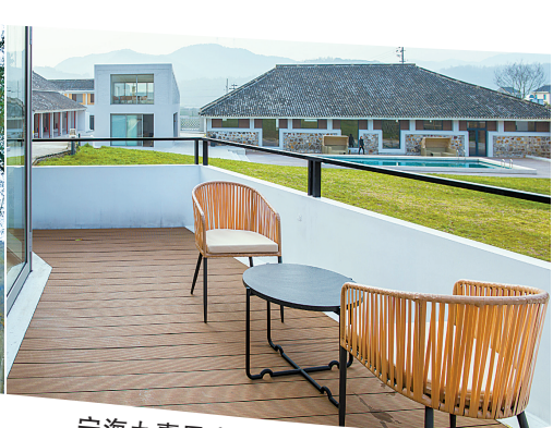
宁海九熹民宿。