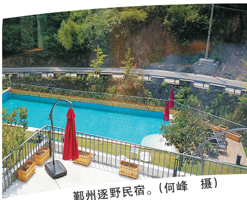
鄞州逐野民宿。