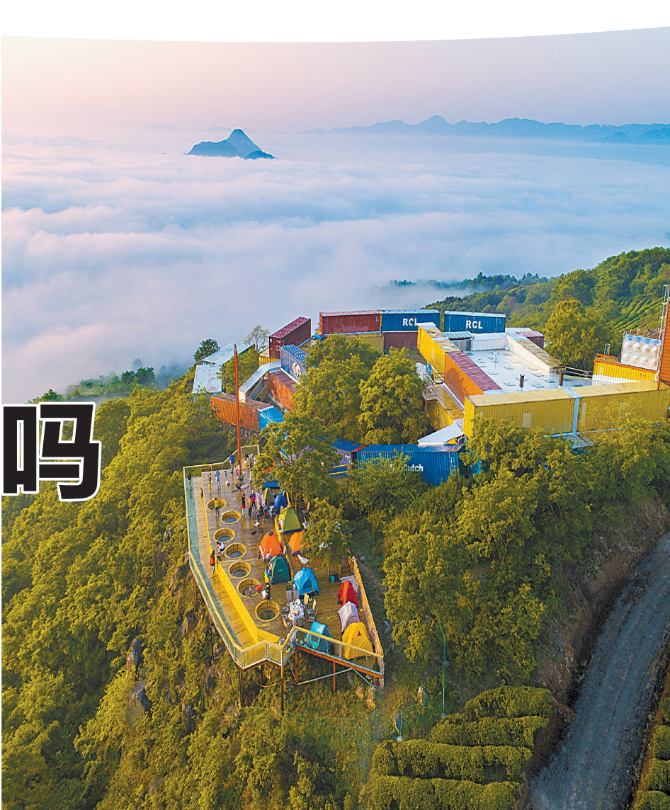
宁海“村在民宿”。