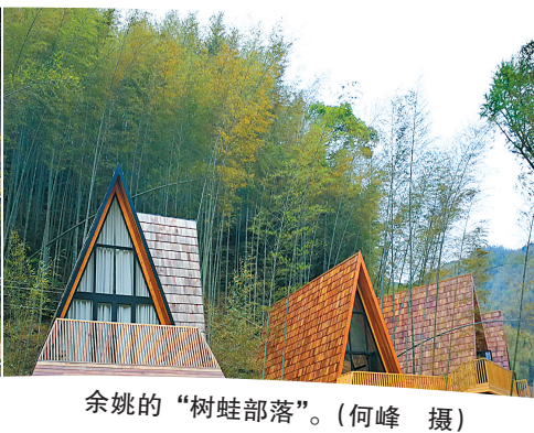
余姚的“树蛙部落”。