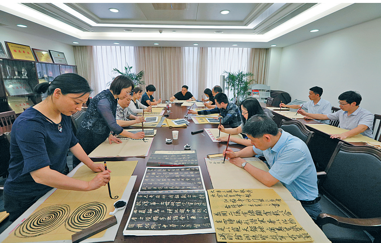
纪检监察干部利用午休时间参加兴趣小组活动。

理信息？” “你的信访件，我们已经按照管理权限转到相关单位了，请不要着急，你是不是还有新的情况反映？”