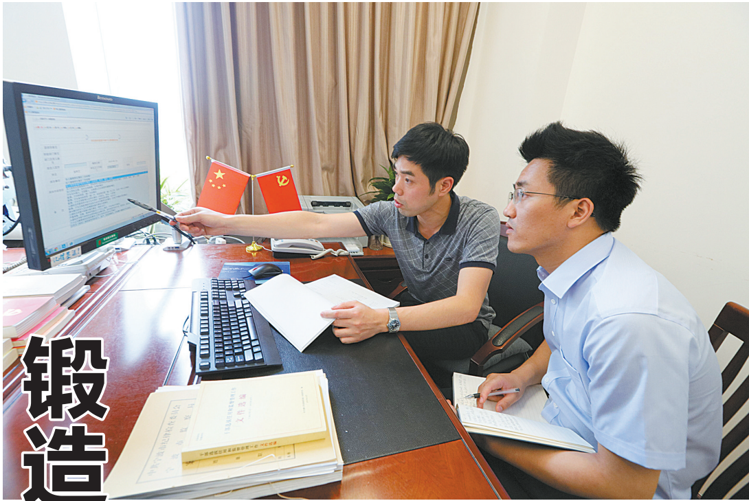
市纪委干部监督室正在对个人重大事项报告进行核查。