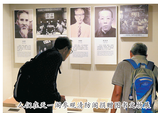
人们在天一阁参观清防阁捐赠图书文物展