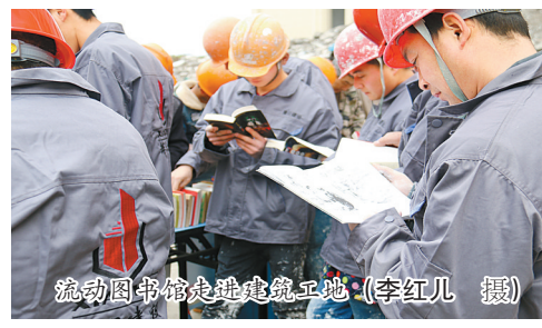
流动图书馆走进建筑工地