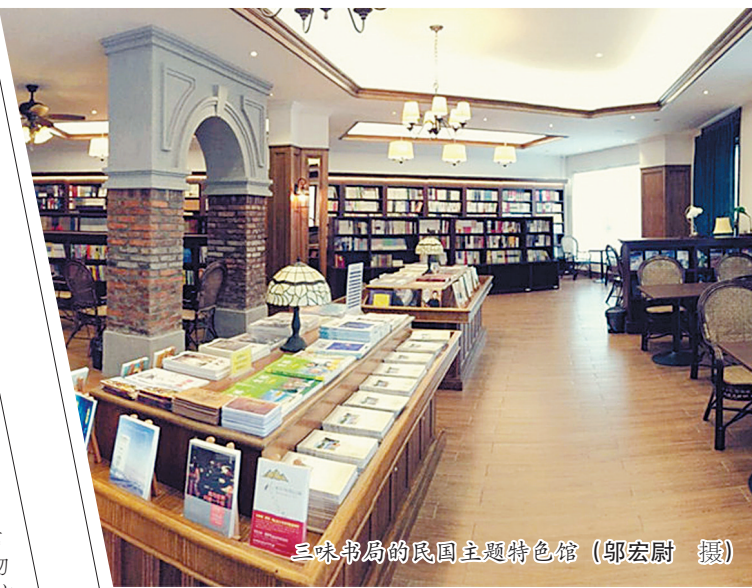
三味书局的民国主题特色馆

李鹏说，关于藏书捐赠，杨家的后人有着共识，那就是古籍放在天一阁是最好的归宿，“更能发挥文献价值，更能有效地传承、保管和利用。天一阁已经成为游客必到之处，它不仅仅是一座藏书楼，更像是一部传承中华文化薪火的‘奇书’，在记录历史进程的同时，惠泽一代又一代后世子孙。”