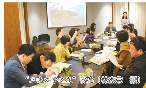
“三味文学之友”沙龙