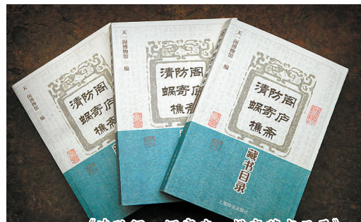
《清防阁·蜗寄庐·樵斋藏书目录》