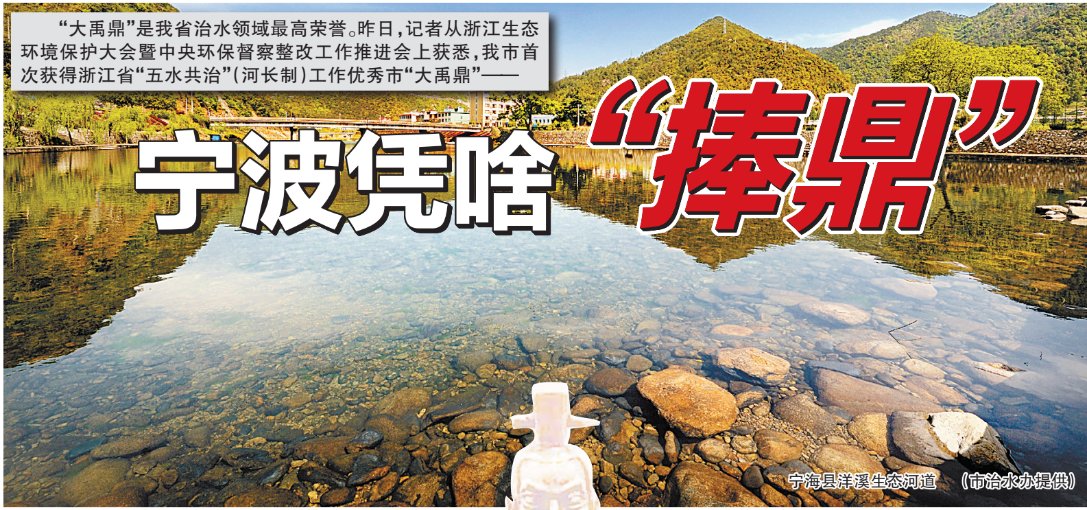
宁海县洋溪生态河道

“大禹鼎”是我省治水领域最高荣誉。昨日，记者从浙江生态环境保护大会暨中央环保督察整改工作推进会上获悉，我市首次获得浙江省“五水共治”（河长制）工作优秀市“大禹鼎”——