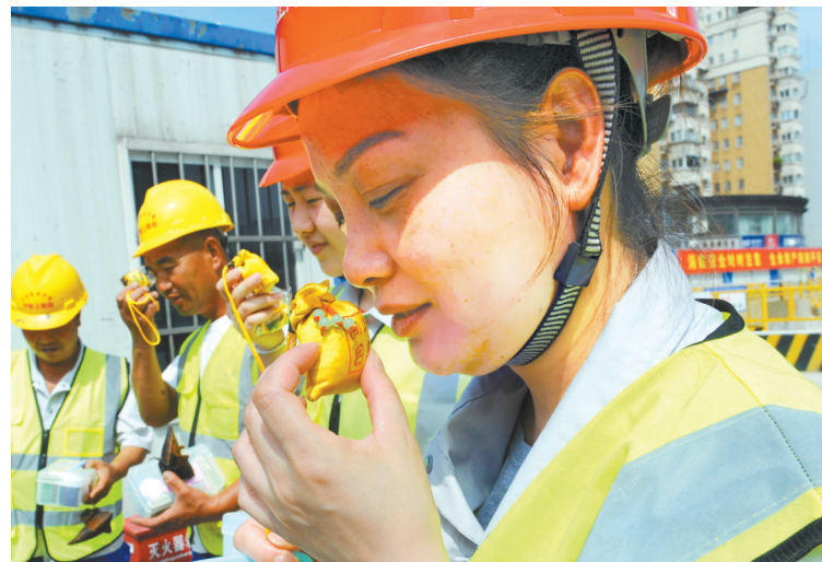
昨天,在中铁上海局宁波地铁4号线建设工地,来自鄞州白鹤社区的志愿者的志愿者们,给正在作业的施工和管理人员送上亲手制作的香袋、粽子以及装有防暑药品的爱心小药箱,向他们表示慰问。