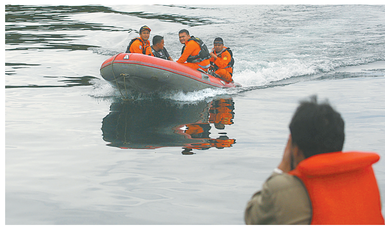
6月20日,在印度尼西亚北苏门答腊省多巴湖,救援人员进行搜救工作。印度尼西亚抗灾署发言人苏托波20日说,北苏门答腊省多巴湖18日发生的沉船事故失踪人数上升至192人,目前搜救工作仍在进行。(新华社/美联)

美国军方资料显示,大约7700名美军士兵1950年至1953年在朝鲜战争中“失踪”。美国国防部说,朝方官员先前告知美方,朝方过去数年搜寻到大约200具美军士兵遗骸。