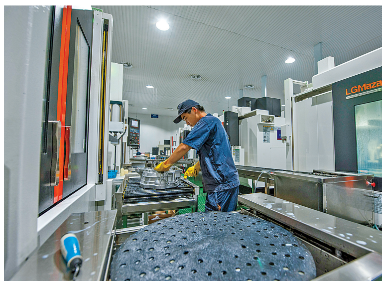
银亿股份旗下制造车间。