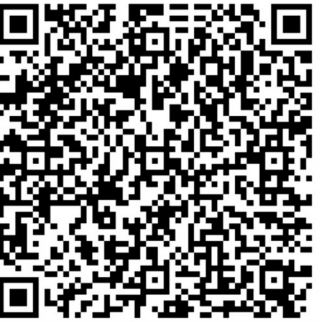
全文请扫描二维码