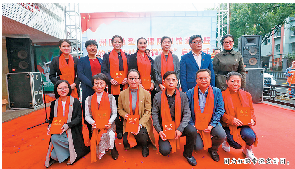
图为红飘带微宣讲团。