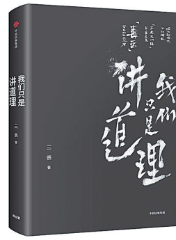
《我们只是讲道理》 三表 著 中信出版社 二〇一八年七月

你知道“萌”和“燃”原本是同一个意思吗？你以为“打CALL”就是加油吗？你知道“小鲜肉”和大妈消费的关系吗？每一天，我们的时代都在生产着新的话语，本书由北大中文系学术团队历经多年研究完成，收录了245个关键词，探索网络文化的核心脉络和词语的根源，完成了这本可读性和知识性俱佳的学术读物。