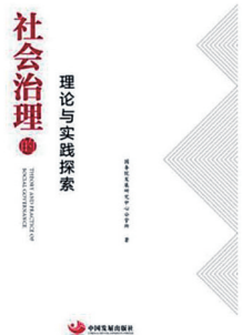
《社会治理·理论与实践探索》 国务院发展研究中心公管所 著 中国发展出版社 二〇一八年七月

在当代中国，国家或政府治理能力对于社会治理来说尤为重要。政府治理能力将成为经济进步的重要因素，也会进一步影响社会各方面的进步。政府要正确认识认识发展方向和规律，采取有效措施促进社会经济健康发展，核心的问题是要处理好政府、市场与社会之间的关系。