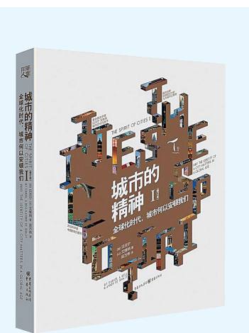
《城市的精神：全球化时代，城市何以安顿我们》 [加]贝淡宁 [以]艾维纳 著 重庆出版社 2018年1月

归属感是人类情感的基本需要，市民对城市精神的自豪感，有助于激发城市的认同感。书中认为，城市精神的形成，取决于城市的具体情况和现有资源。如果一个城市贫穷，人们被剥夺了最基本的物质需要，那么，城市的首要任务就是摆脱贫穷，让市民有基本的医疗保障。离开民生谈城市精神，则是在纸上谈兵。