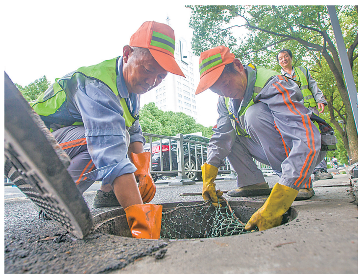
管网巡检人员在检查窨井防护网。