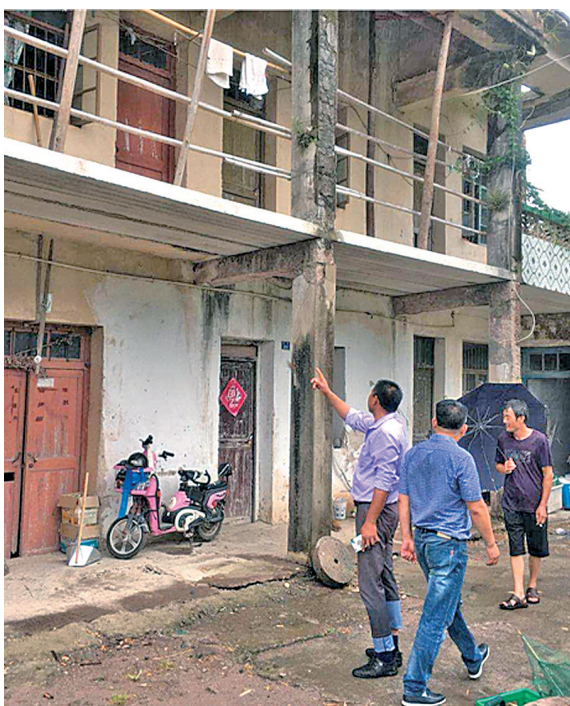
昨天,宁海长街镇及时组织人员进村入户,做好人员转移避险及安置工作,确保“险情不解除、人员不回迁”。

又讯(记者厉晓杭 通讯员虞南)台风“摩羯”昨天深夜登陆温岭,给我市带来明显风雨影响。昨天我市拉响防台警报,并发布台风黄色预警。受“摩羯”影响,从昨天开始,我市普降中雨,局部暴雨。截至昨晚22时,全市面平均雨量为28.3毫米,区县(市)中排