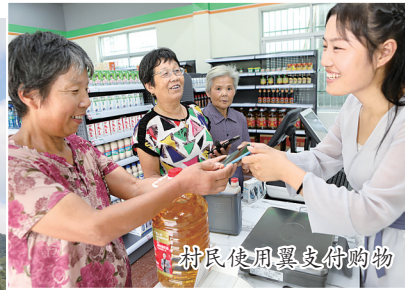
村民使用翼支付购物