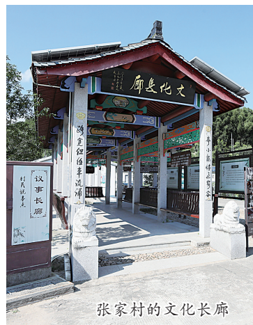
张家村的文化长廊

天上的云，看得见摸不着，远在天边；张家村的“云”，看不见摸不着，却近在眼前。时代的潮水涌来，曾经闭塞的张家村蝶变成了“云上村”。