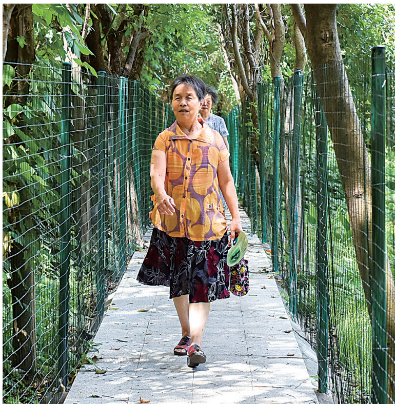
小区居民走在便民小道上。

除了开辟“便民通道”，江北城管局的“bo绿”服务队还定期开展“扰民树”修剪专项服务；近日还帮小区在南大门外规划了公共停车区域，以改善小区南侧的乱停车现象。