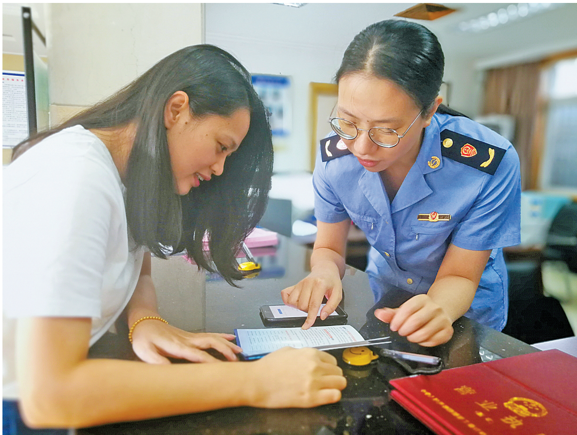
市场监管工作人员向企业负责人宣传注册便利化。

除了经营范围的全类登记，宁波在全省率先开展“证照分离”改革，破解市场主体“办照容易办证难”“准入不准营”等问题。目前，镇海、北仑、高新