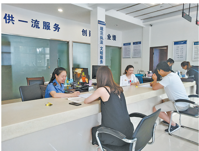
一窗受理，群众办事更便捷。