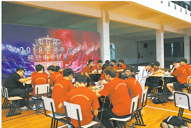
2018宁波高校移动电竞联赛春季赛现场。