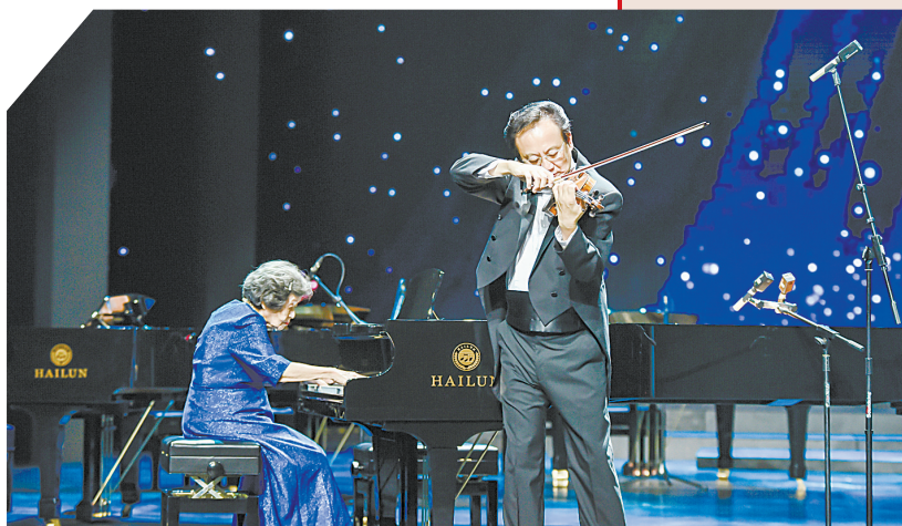
宁波国际钢琴艺术节上，中国第一代钢琴演奏家巫漪丽和著名小提琴演奏家薛苏里合奏《梁祝》。

宁波大学音乐学院副教授沈浩杰认为，建设“音乐之城”不能仅停留在概念、口号上，而应该扎扎实实地做一些基础工作。他建议不