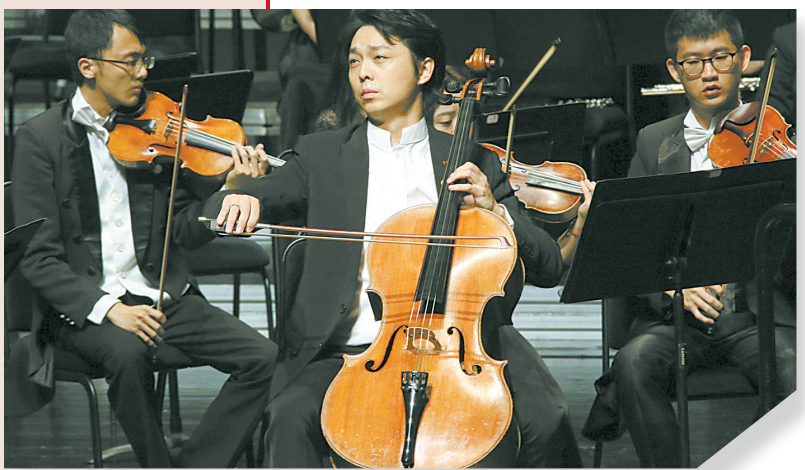
开幕式音乐会上，著名大提琴演奏家秦立巍演奏大提琴协奏曲《洛可可主题变奏曲》。

伴奏组曲——DG公司历史上，也只发行过两位大家的立体声演出，一个是1960年的法国巨匠富尼埃，一个是1988年的苏联名家麦斯基，王健这套对唱片公司而言，可称二十年磨一剑。23日下午，开元名都四楼的新闻发布会临近结束，我把巴赫“大无”的唱片内册递上请他签名，刚才一脸严肃的他顿时乐开了花，不单是欣然签就，还被我拉着聊了一刻钟光景——也许是受此触发，次日晚在保利剧院，他加演的便是巴赫“大无”第一组曲的萨拉班德，她是最典型的王健风格，沉甸甸的高密度发声，如老僧入定。