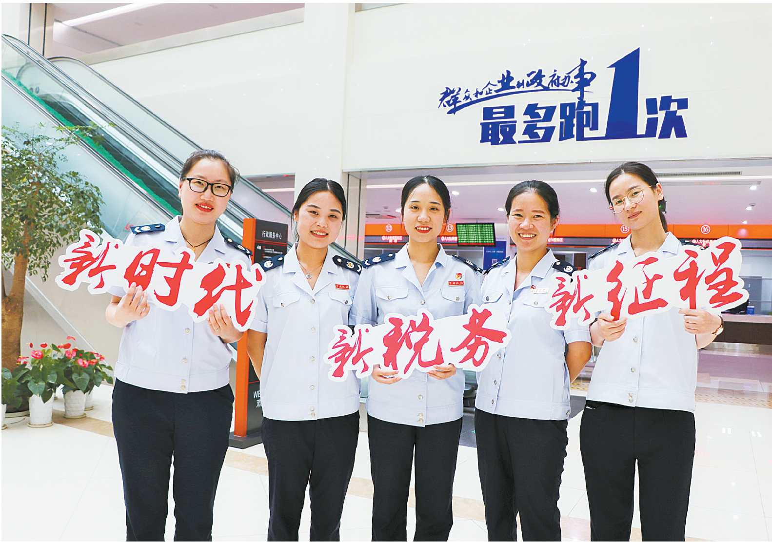
全市税务干部以崭新面貌积极助力“最多跑一次”改革

今年恰逢改革开放40周年,党中央着眼完善税收体制、优化政府服务,作出了国税地税征管体制改革的重大决策。自6月15日国家税务总局宁波市税务局挂牌成立两个多月来,全市税务系统蹄疾步稳、有力有序推进各项工作任务,顺利实现推动征管体制改革和抓好日常税收工作“两不误、两促进”。近日,国家税务总局宁波市税务局党委书记、局长梅昌新接受了本报记者的专访。