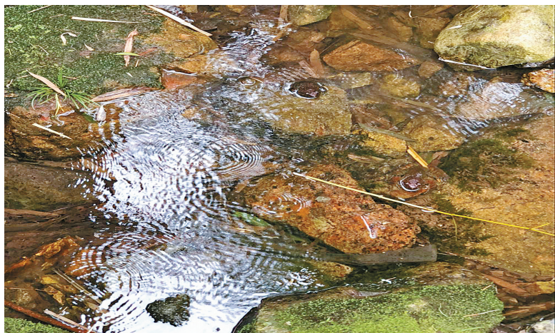
被东吴派出所民警放归大自然的石蛙。