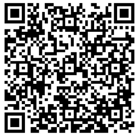
(《中共中央关于追授黄群、宋月才、姜开斌、王继才同志“全国优秀共产党员”称号的决定》全文请扫描二维码)

织要积极主动帮助他们解决实际困难，在思想、工作和生活上给予更多关心爱护。 为深入学习贯彻习近平总书记重要指示精神，大力宣传信念坚定、对党忠诚、担当作为、干事创业的新时代典型，激励和引导广大党员干部进一步把思想和行动统一到习近平新时代中国特色社会主义思想上来，不忘初心、牢记使命，履职尽责、许党报国，努力创造无愧于时代、无愧于人民、无愧于历史的业绩，党中央决定，追授黄群、宋月才、姜开斌、王继才同志“全国优秀共产党员”称号。 (据央视《新闻联播》)