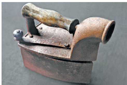
早年舶来的盒式熨斗