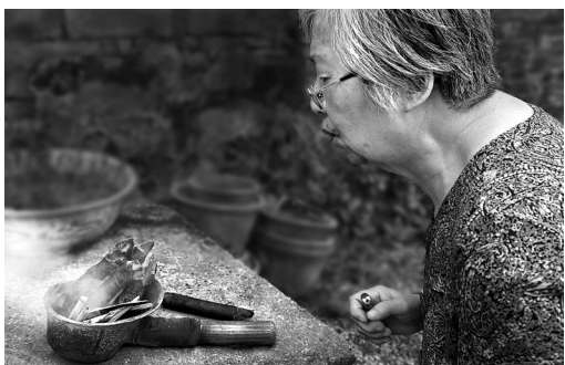
中式熨斗生火时烟较多，往往需要先端到室外

包玉刚故居位于镇海区庄市镇钟包新村的后新屋，是已故“世界船王”包玉刚先生的出生地。故居为我国江南传统民居的砖木结构，自1984年包玉刚先生首次回乡以来已历经三次修葺，2005年年底大修时，还开辟了小花园。（丁安 绘）