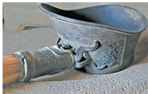
老熨斗的手柄做得很精细