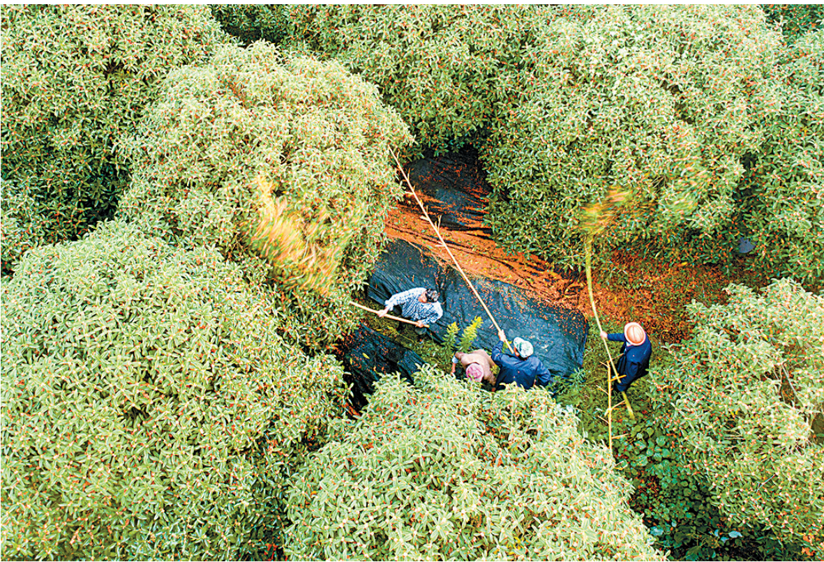
工人们在象山贤庠镇百汇桂花基地“打桂花”。

据了解，百汇桂花基地最高年份能产鲜桂花5万公斤。除了卖桂花的收入外，还有40多个品种的桂花树对外销售，今年基地经济收入预计可达70万元。