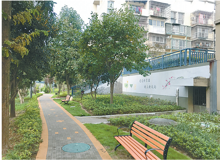
三和嘉园小区一角。