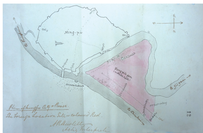
▲宁波江北岸外国人居留地最早的彩图