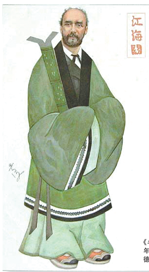
▲中国赫德——《名利场》杂志1894年12月号刊登的赫德漫画像。

“洋轮”颁发执照而犹豫不决。段光清以“轮船虽外洋所造，中国商人买之，即中国商船”为理由，破例发给了执照。当时，有官员因非议此事，上奏咸丰皇帝。段光清以“现在钟、表、毡呢、洋布各物，用之者遍国中，况轮船北更能捕盗有功也”应对。最后，咸丰帝也只能回之以“知道了”不置可否的几个字，默认了此开放之举。