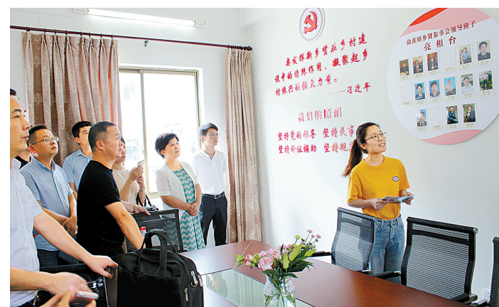
涂茨镇的“乡贤之家”。