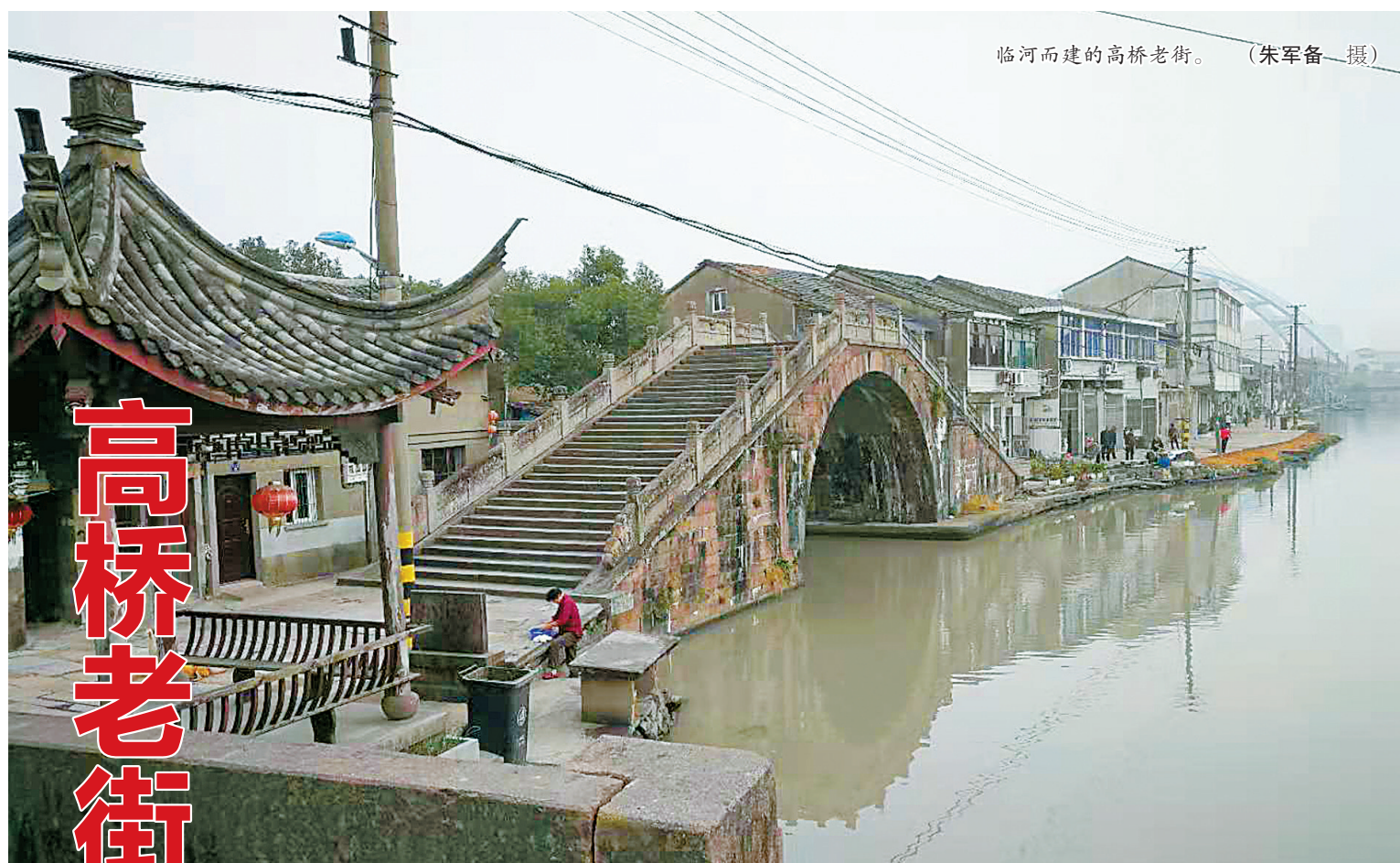
临河而建的高桥老街。