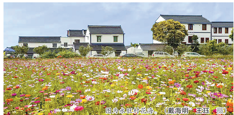
图为永旺村花海。