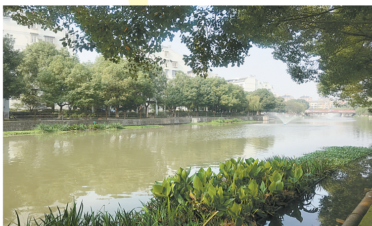
南新塘河展新颜。

家住南新塘河边香梅家园的居民孙阿姨每天傍晚会来到河边散步，对家门口这条河流的新貌，她感触很深：“过去，这里水体发黑，还散发出阵阵臭味，居民离得远远的；现在，大家走在河边是一种享受，感觉生活质量