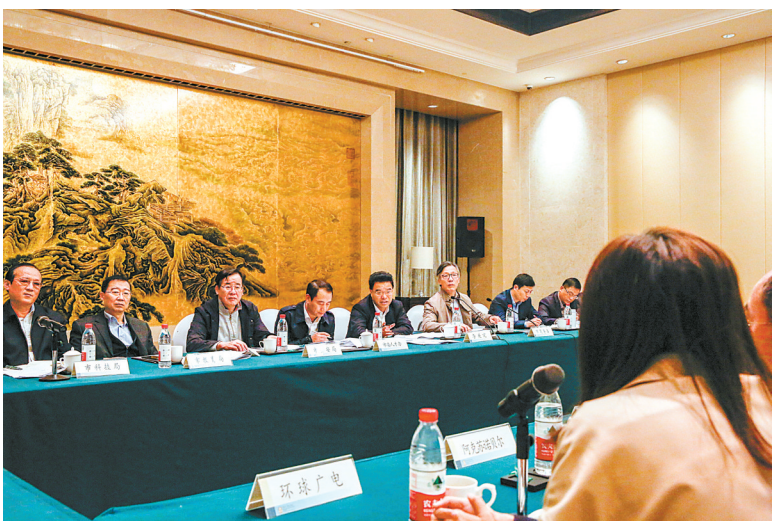
全市外资企业恳谈会现场

40年来，外资企业见证、参与和推动了宁波的成长和发展。行百里者半九十，那么当下，什么才是外资企业的所思所想？宁波将给予外资企业何等新机遇与平台？我市如何再进一步更好地促进外资发展？