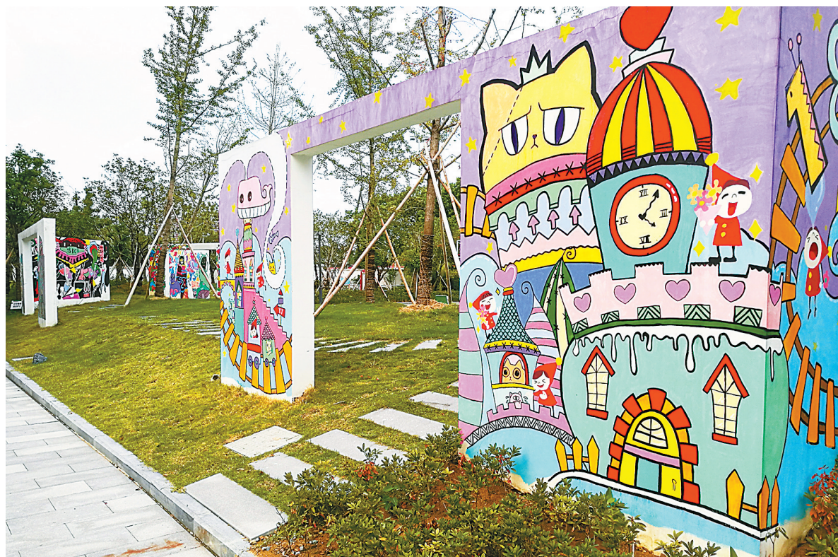
美丽校园里有关垃圾分类的漫画随处可见。

于是，该校采取每天播报的方式，将容易混淆的垃圾分类知识当作课堂教育的一部分。每天上课前一分钟，同学们坐在教室里先聆听一段宣传垃圾分类知识的广播，不