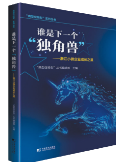
《谁是下一个“独角兽”》 “典型促转型”丛书编辑部 主编 中国市场出版社 二〇一八年十月

过去的20多年，华为从未一帆风顺，今后的20年，华为也将困难重重。是什么造就了华为强大的思想力量和意志力？为什么发展如火如荼的华为一直思考着“生存与死亡”的问题？这正是本书想要解开的谜题。