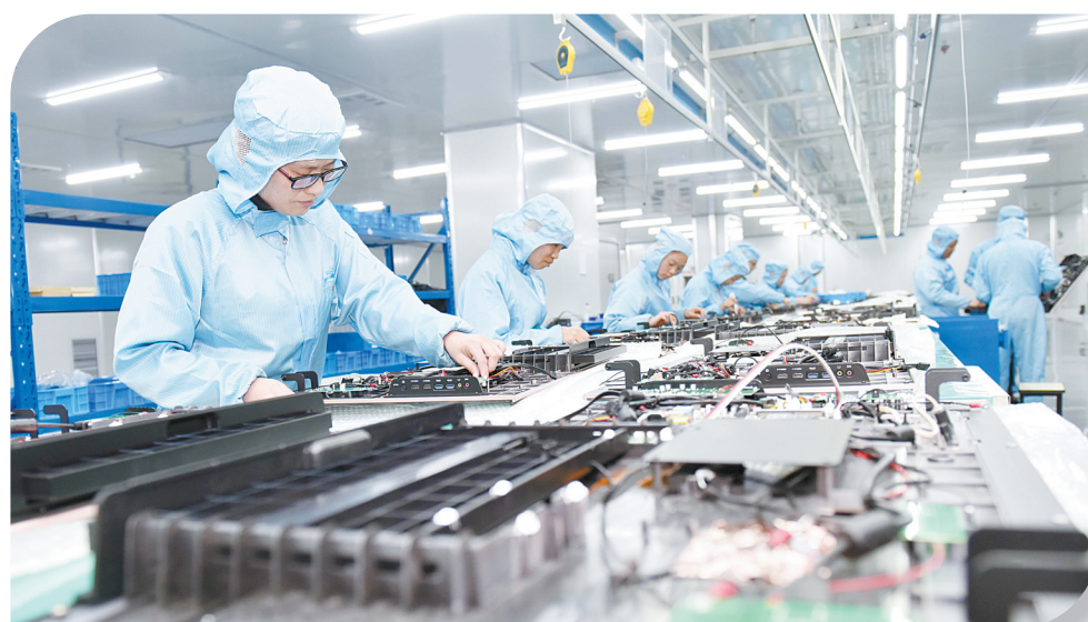
智能经济蓬勃发展的景象