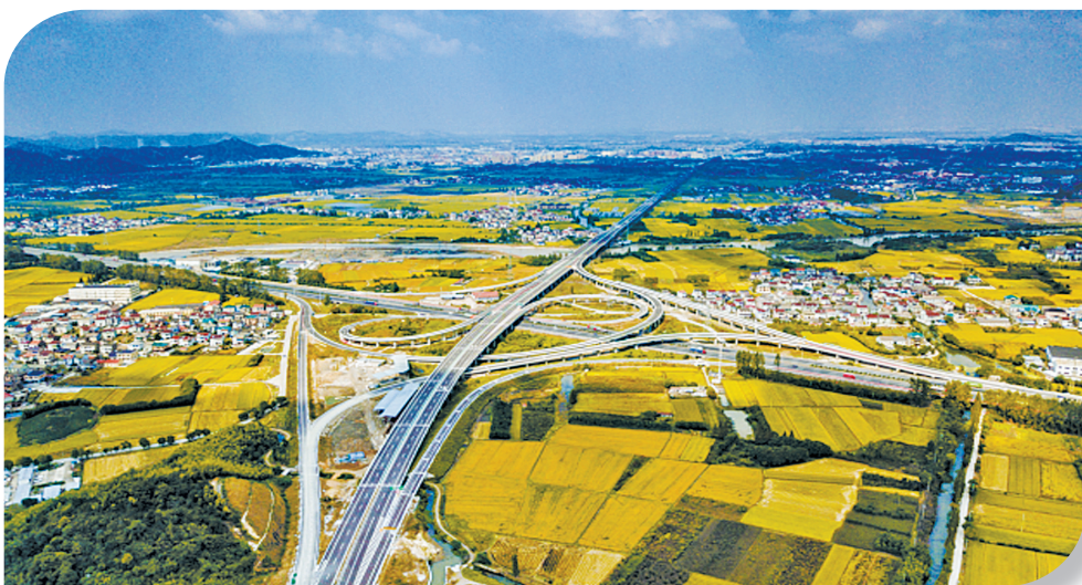
交通网络四通八达