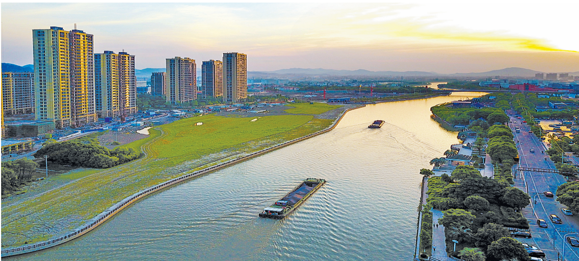
山水城市风光秀美

发力全域美丽不松劲。余姚不断深化推进全民共建美丽家园，打好治污攻坚战，小城镇环境综合整治、剿灭劣V类水等攻坚战，创建成为省“清三河”达标县，“母亲河”姚江成为省级美丽河道创建名单。生态建设持续向好，荣获森林城市、国家园林城市、“全球绿色城市”、国家卫生城市等称号。