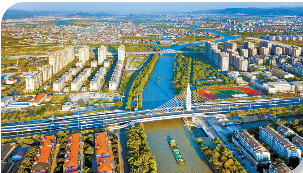
城市形象日新月异