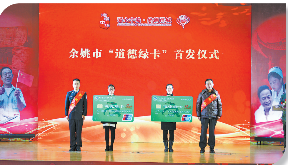
“道德绿卡”首发仪式