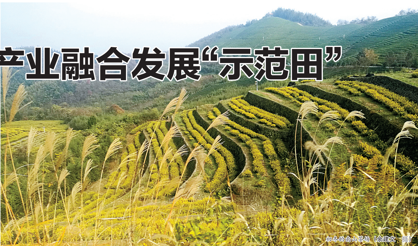
初冬的尚山茶场

今年8月，农业农村部、财政部发布《关于批准开展2018年农业产业强镇示范建设的通知》，批准全国254个镇(乡)开展农业产业强镇示范建设，奉化区尚田镇入选其中，成为我市唯一上榜的乡镇。