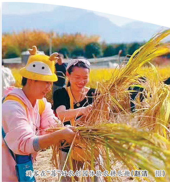
游客在“莓”好农创客园体验农耕乐趣