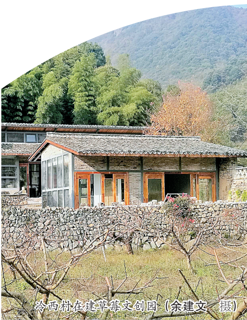
冷西村在建草莓文创园

近年来，尚田先后投入3000万元开展农业产业基础设施建设，建成茶叶产业示范区两个、茶叶精品园1个、草莓产业示范基地两个、精品生态果园1个，大力推进农旅融合，为农村一二三产业融合发展奠定了基础。目前，全镇有南山茶厂茶叶采摘基地、冷西草莓采摘基地以及农家乐30余家，年接待游客20多万人次，旅游服务年总产值近亿元。