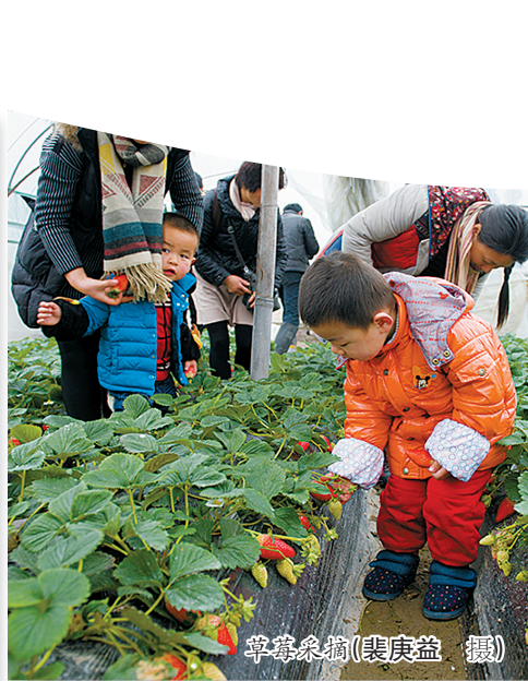
草莓采摘