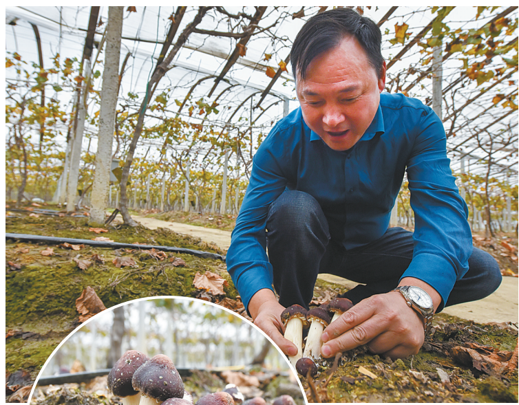
图为阿东水果专业合作社收获第一批酒红菇。