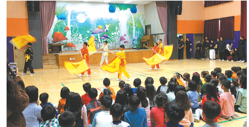
北仑梅山学校的学生向韩国济州一所小学的师生展示梅山水浒名拳。