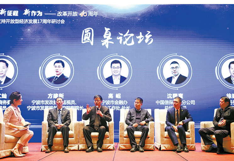
圆桌论坛环节，各位嘉宾畅所欲言。

12月18日，宁波日报报业集团、中国出口信用保险公司宁波分公司联合主办了“改革开放40周年暨中国信保支持开放型经济发展17周年研讨会”，来自市经济部门、各大研究机构、外贸企业的150余名代表，就上述话题展开了讨论与交流。