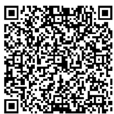
扫二维码,查看516家上榜培训机构名单。

取得办学许可证后继续办学,对未停止办学的“无证有照”机构将提请市场监管部门依法吊销其营业执照;对未取得办学许可证、也未取得营业执照的机构(“无证无照”),必须立即关停,未关停的将依法予以取缔。