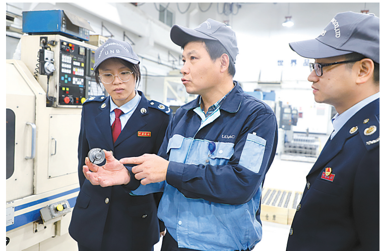
近日,高新区税务部门开展民营经济发展大走访活动。税务人员走进宁波海乐基因科技有限公司和宁波爱发真空技术有限公司,调研了解企业发展状况及目标,认真听取企业意见建议和涉税诉求,推送适用的税收优惠政策,助力企业更好更快发展。