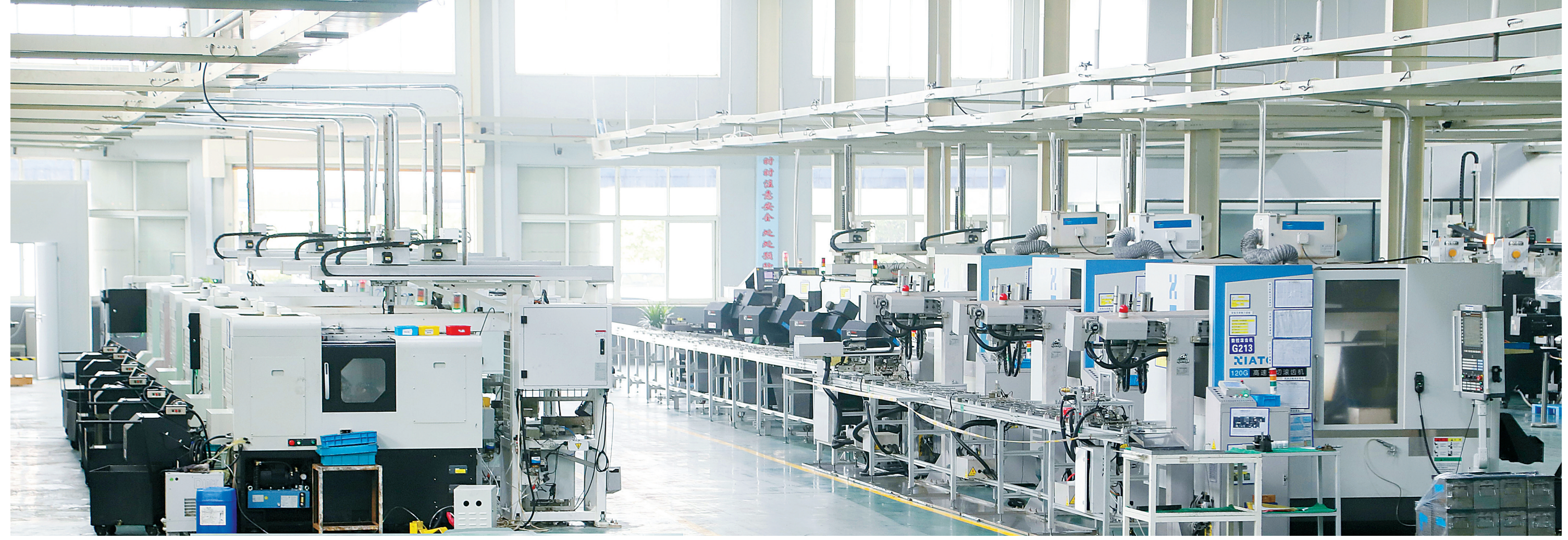
智能化改造让我市企业生产效率明显提升。

进入2019年，连日的阴雨并未挡住芯港小镇加速崛起的步伐。在北仑云台山路上，5个项目建设工地机器轰鸣，一派热气腾腾的景象。自芯港小镇启动开发以来，一批集成电路产业项目负责人接踵而来，实地考察、洽谈对接、签约落户，让原本静谧的园区热闹非凡。 在芯港小镇内，总投资43亿元的中芯宁波N2项目蓄势待发，作为聚焦模拟及特种工艺集成电路的项目之一，中芯宁波N2项目将针对国内产业布局相对薄弱的环节重点发力。目标市场覆盖移动通信及手持设备、智能家电、工业控制和机器人、汽车电子及新能源汽车、增强现实及虚拟现实系统等领域。 与中芯宁波N2项目比邻而居的南大光电项目也将在国内首次建立ArF光刻胶产品大规模生产线，形成年产25吨