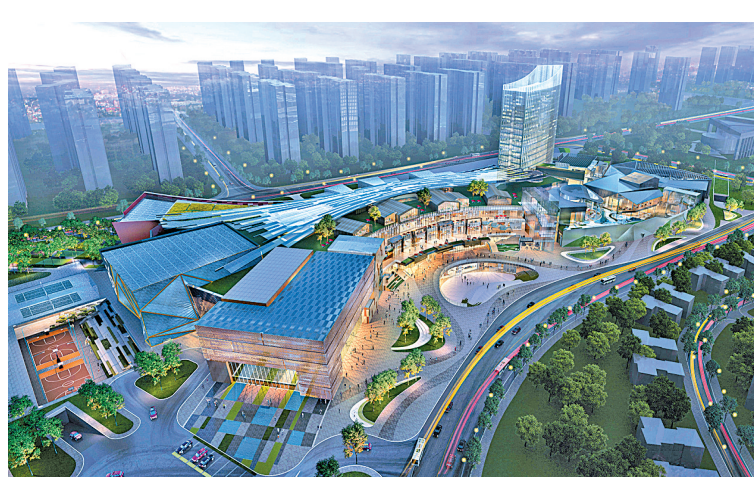
港中旅温泉湾：集运动、健康和创新生活方式相融合的温泉主题城市度假综合体。

“北大附属实验学校体系”进行国际化升级转型，而此次签订的宁波北京青岛同文实验学校则是北大附属实验学校的“进阶版”，旨在培养具有深厚传统文化底蕴和开阔国际视野的新一代民族精英。