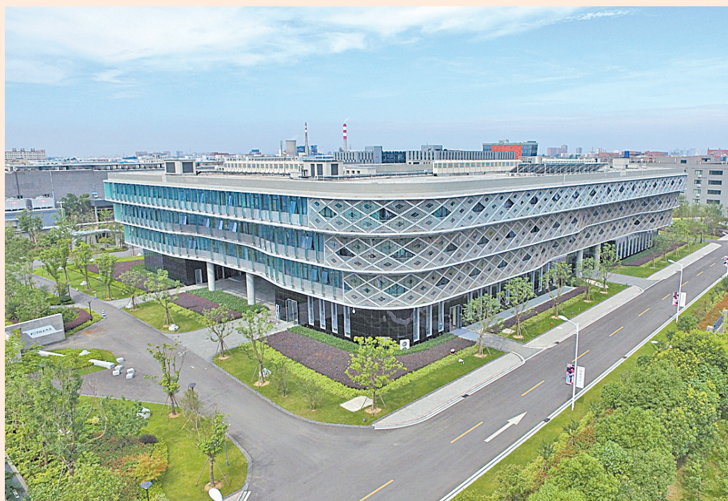
方大集团：国内首家营收规模突破百亿元的铜企企业。