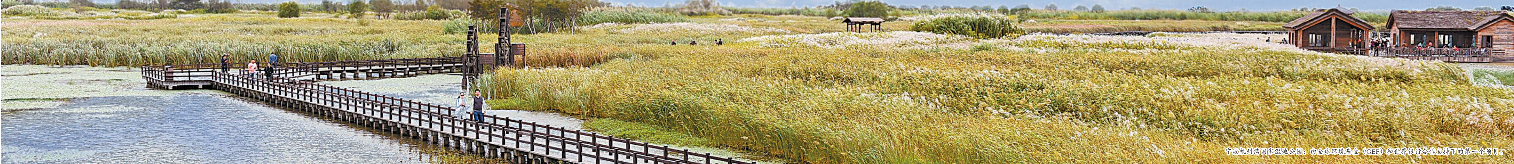
宁波杭州湾国家湿地公园：由全球环境基金会（GEF）和世界银行合作支持下的第一个项目。

不驰于空想，不骛于虚声，矢志追梦，同心筑梦！刚刚过去的2018年，宁波杭州湾新区笃行“六争攻坚”，加快建设“名城名湾”，形成新路径、集聚新智慧、贡献新方案，取得了一个个跨越，实现了一次次突破，在高质量发展先行区建设中，再次引领，再续辉煌。