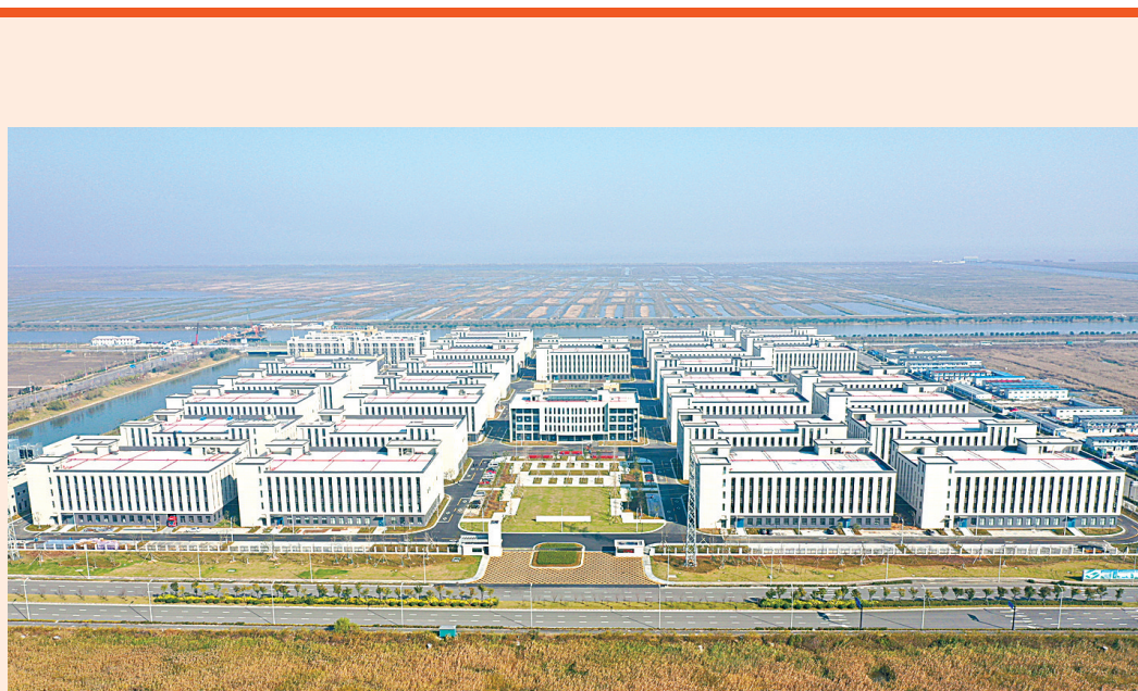
数字经济产业园：打造数字经济高地的又一千亿元级创新平台。

2018年，全年共落户吉利PMA纯电动汽车、吉利汽车全球研发总部二期及三期等33个项目，总投资800.26亿元，同比增长70.4%，创历史新高。其中，高端制造业项目27个，总投资380.26亿元，占比48.8%，同比增长66.5%，涵盖新能源汽车、汽车研发及零部件、智能终端、生物医药、新材料等行业领域。截至目前，新区已累计引进了德国大众、美国伟世通、荷兰联合利华、韩国LG等22家世界500强企业投资项目36个。