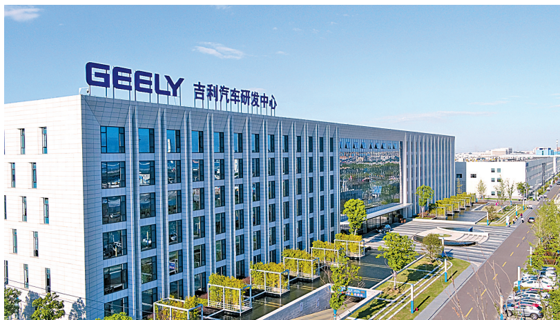
吉利汽车全球研发总部：吉利汽车的全球研发大本营。