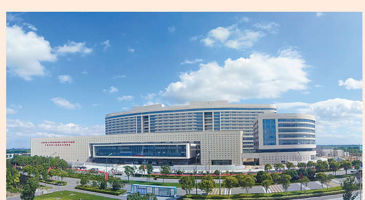
宁波市杭州湾医院：打造宁波乃至浙东地区高端医疗中心。

晨光熹微，李宁体育园绿茵场的外国人，成为朝阳中一道最美的风景；华灯初上，北塘巷酒吧街尽情畅饮的外国人，成为夜色中最迷人的风情。而今，在宁波杭州湾新区，国际化已经成为新区的城市标签。