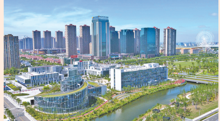
滩涂上崛起一座品质新城。