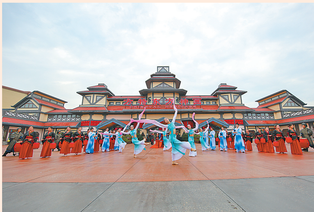
方特东方神画：全球最大高科技VR主题乐园。

“国际化产业名城，现代化美丽湾区。”这是新区制定的小目标。以“五个梦”实施路径加快“名城名湾”建设中，全国58个产城融合试点开发区之一的宁波杭州湾新区，除了国际化的中高端产业，也应有与之相匹配的国际化城市功能供给。