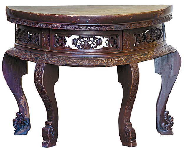
奉化楠木半月桌(清代)

旧时取名半月桌，还反映了古人的一种审美趣味，此所谓残缺美。月上柳梢头，柳梢上一弯新月如眉，楚楚动人，美得让人怜爱，或许是一种更高级的美。所谓“一种相思，两处闲愁”，阴晴圆缺，物化世相，也总让人常生别离的伤感和团圆的喜悦，感叹世事的无常，更加珍惜人间亲情的的美好。