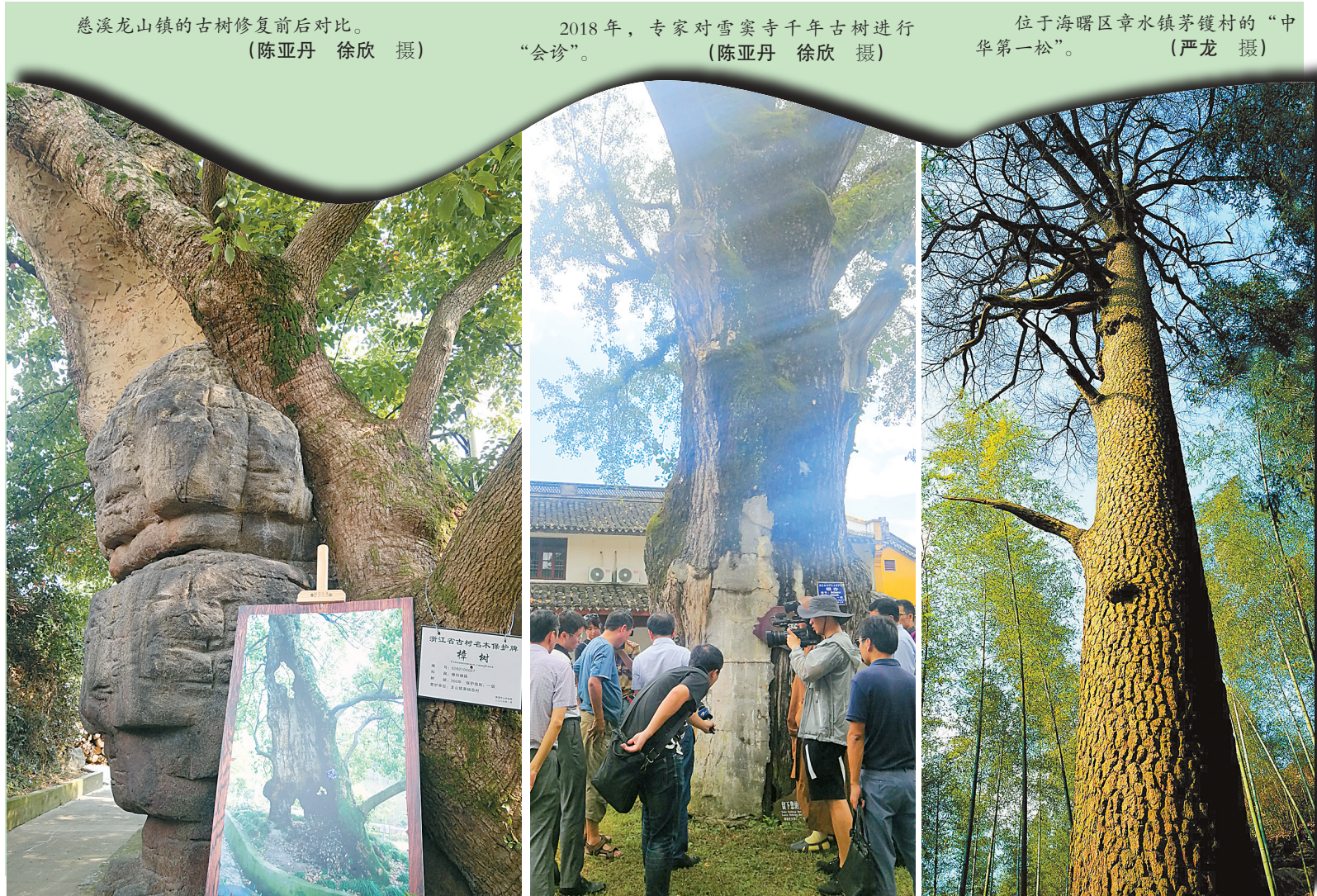
慈溪龙山镇的古树修复前后对比。