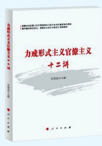
《力戒形式主义官僚主义十二讲》(预售) 人民出版社 二〇一九年二月

将于2月份出版的这本书，着眼于《工作意见》重点整治的12类突出问题，每个问题都选取典型案例进行详细解析，并配以精美漫画，图文并茂地阐释了力戒形式主义、官僚主义的必要性、紧迫性。