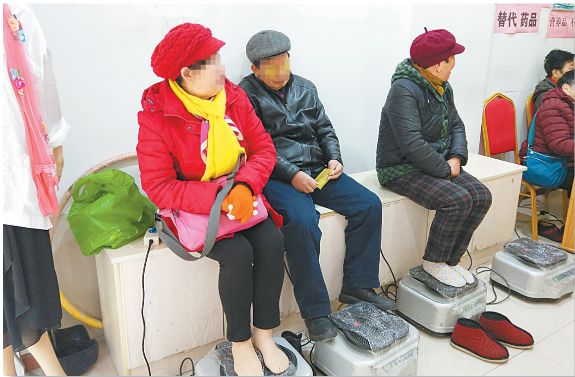
老人在海曙区一家“健康家园”体验足底按摩。

早晨买菜做完家务,去附近一家“健康家园”做个足底按摩,和老伙计聊聊家常,说说最近哪里好玩、过年了要不要团购一些东西。有时候还会现身说法,与老伙计分享自己服用“保健品”的心得——这是市民黄阿姨的日常。几年来,在一家叫赛尔复得的植物饮料上,她已经花了十多万元。