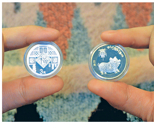
图为2019年贺岁纪念币。

春节临近，我市各大收藏品市场人气持续攀升。一些市民前往集市“淘宝”，准备给孩子们包个纪念币压岁包。“近段时间，来店里买‘人民币发行70周年’纪念钞和猪年贺岁纪念币的市民挺多。这两种面市不久的纪念币（钞）精致美观，市场价格也不高，用来做压岁钱正合适。”宁波古玩城经营户王先生说。