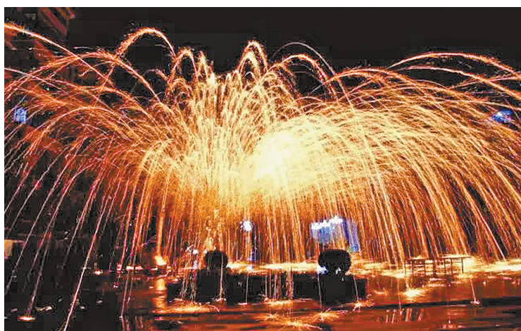
被誉为“民间烟火之最”的“打铁花”将在东钱湖上演。

又讯（记者朱军备 通讯员陈家燕）新春佳节，梁祝文化园总会迎来游客入园高峰。今年春节元宵期间，文化园将推出以“金猪喜迎春 梁祝闹元宵”为主题、梁祝为特色的文化旅游活动，包括梁祝情景剧、非遗美食街、第四届中国梁祝年画展、郁金香花展、梁祝元宵游园会等。