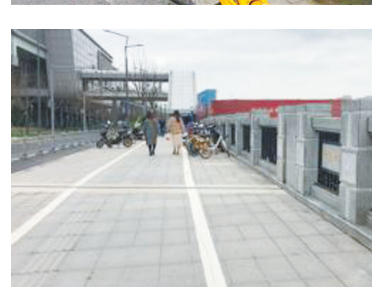
上图:整治前,下图:整治后。

2018 年 11 月 7 日,宁波日报、中国宁波网曝光了北高教园区宁波大学门口、宁大地铁站周边的乱象:共享单车停放杂乱,部分共享单车直接停放在非机动车道上;无证摊贩横行,占用人行道和机动车道;无牌无证三轮车非法运营,险象环生。