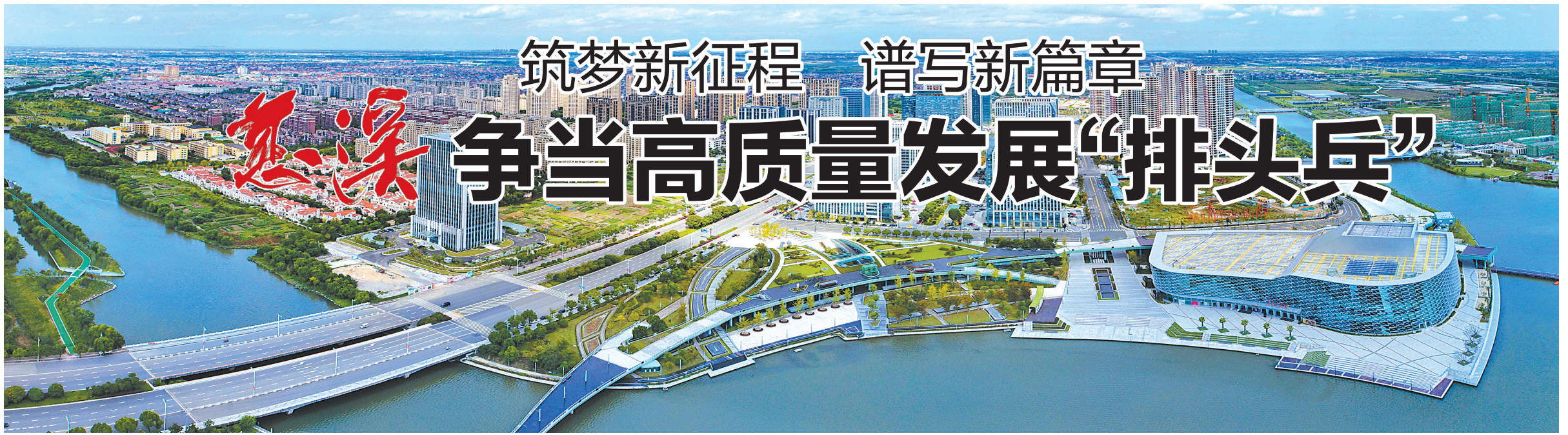
环杭州湾创新经济区。