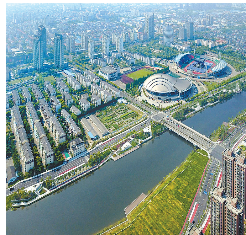
新城河风景。

新的一年，如何继续“领跑”、开创高质量发展新局面？慈溪给出的答案是：坚定信心克难奋进，抢抓机遇争创优势，推动创新活力之城美丽幸福慈溪建设取得更大成效；努力以思想大解放、行动大担当推动大开放大发展，在全面