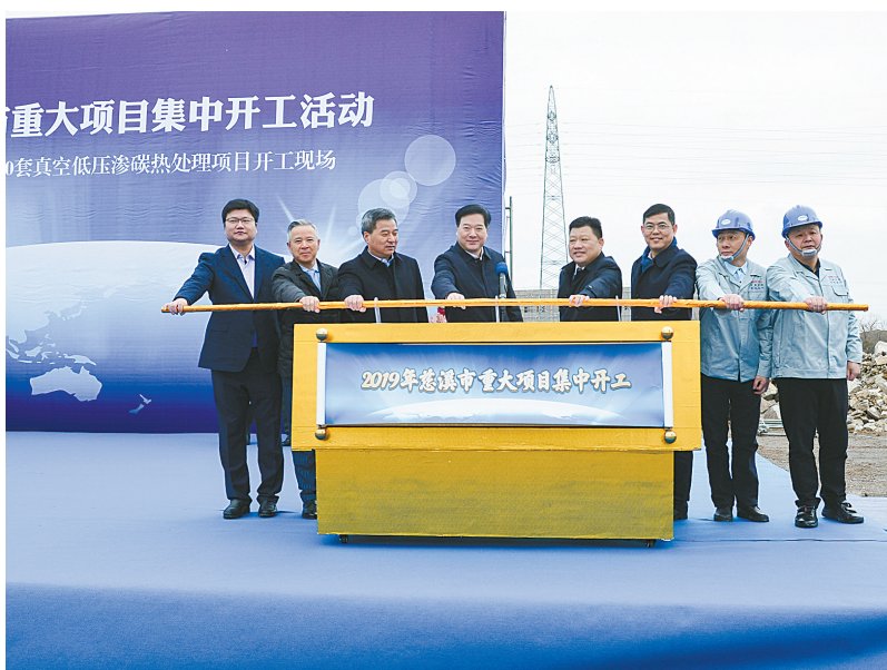
重大项目集中开工现场。