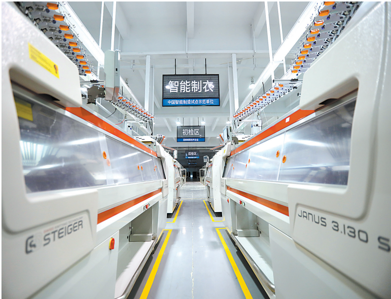
12月7日，在宁波慈溪慈星股份，针织鞋服智能化示范工厂。