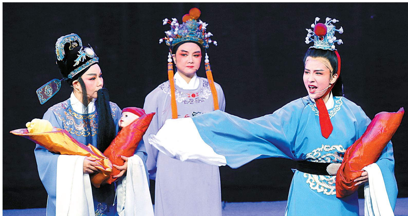
昨天下午,宁海平调越剧团的《琼浆玉露》在逸夫剧院上演。